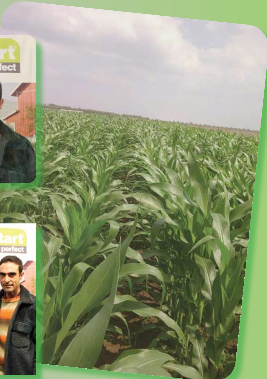
Campo de Maíz abonado con Umoplast Perfect en Pinseque (Zaragoza).